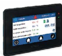
Terminale utente touch-screen di ultima generazione.