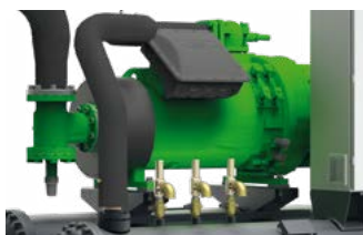
Compressori a vite ad alta efficienza progettati per refrigerante R513A.