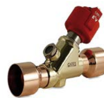
Valvole di espansione elettroniche.