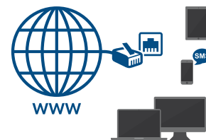
Connettività con sistemi di supervisione.