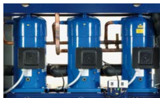
Ottimizzazione delle prestazioni grazie alla logica multiscroll.