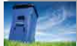
Biogas da rifiuti organici