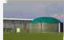
Biogas da fonti agricole