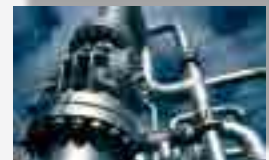
Biogas da depuratori